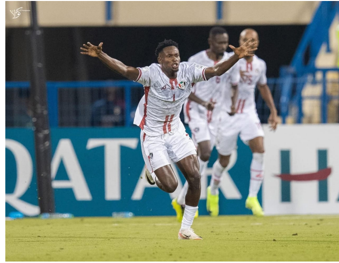
الفوز والصعود رفقة كبار المنتخبات العربية المتأهلة للبطولة العربية المنتخب اللبناني تقدم

حقق المنتخب السوداني لكرة القدم فوزا غاليا على المنتخب اللبناني في المباراة التي جرت باستاد الغرافة بالدوحة ضمن الملحق المؤهل للبطولة العربية بقطر حيث تجاوز المنتخب السوداني ظروف طرد مهاجمه جون مانو في الدقيقة ٢٢ من الشوط الاول ليكمل الفريق المباراة ناقصا بعشرة لاعبين دون أن يؤثر النقص العددي في مستوى لعب المنتخب بل ازداد حماس لاعبي المنتخب الوطني من أجل تحقيق