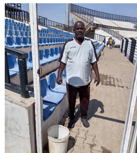
المعدات اللازمة والمواد الصديقة للبيئة لإعادة الحياة إلى مقاعد قلعة شيكان أبطال-المبادرة- لأخ الرياضي زيزي – قائد

إن هذه اللفتة البارعة لم تكن سوى تعبيراً عن الانتماء والحب لهذا الصرح الرياضي الذي يمثل قلوب الكثيرين. وقد لاقت المبادرة استحساناً واسعاً من الجمهور والمسؤولين، منوهين بالجهود المبذولة ودعين إلى توسيعها حتى تشمل جميع أرجاء الاستاد وتكتمل فكرة النظافة بعلامة كاملة. هذه المبادرة كبادرة لهضة رياضية شاملة في مدينة الأبيض. ومن المتوقع أن يتم تطوير