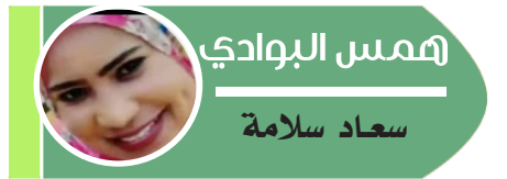
أحمد البوادي سعاد سلامة