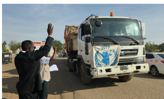
تابعة للأمم المتحدة في منطقة «الله كريم» بشمال كردفان. وناشد المجتمع الدولي باتخاذ خطوات عملية

لتجريم هذه الانتهاكات التي تخالف القانون الدولي الإنساني، داعياً إلى ضرورة احترام القوانين الدولية، وحماية المدنيين، وضمان سلامة القوافل الإغاثية. كما أكد المفوض أن حكومة ولاية شمال كردفان تولي أولوية قصوى لتأمين وصول المساعدات إلى جنوب كردفان، بهدف تعزيز النسيج الاجتماعي بين ولايات كردفان الكبرى، ودعمًا لصمود المواطنين في وجه مليشيا آل دقلو الإرهابية. ووجه عبد الرزاق تحية إجلال وتقدير لصمود وتضحيات القوات المسلحة السودانية والقوات المساندة لها في معركة الكرامة دفاعاً عن الأرض والعرض.