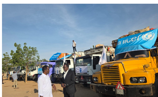
وأعرب عبد الرزاق عن إدانة المفوضية واستنكارها الشديد لاستهداف المليشيا لقوافل المساعدات، مشيراً إلى الحادثة الأخيرة التي استهدفت قافلة