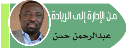
من الإدارة إلى الريادة

الخدمات الحيوية مثل الإيرادات، والمياه، والصحة، والتعليم، وربط كافة الخدمات المقدمة إلكترونياً بالسجل المدني لضمان التكامل والدقة ومنع الازدواجية. ويأتي تدريب الكوادر المحلية في صدارة هذه الاستعدادات. فالتحول الرقمي لا ينجح باستيراد الأنظمة فقط، بل ببناء قدرات بشرية قادرة على تشغيلها وتطويرها وصيانتها. وهنا يبرز دور حكومة الولاية في وضع برنامج متكامل للتدريب الداخلي والخارجي، يشمل دورات تخصصية داخل السودان، وشراكات تدريبية مع مؤسسات إقليمية ودولية، مع ضمانات تحفيزية للحفاظ على الكوادر ومنع تسربها، عبر بيئة عمل جاذبة ومسارات مهنية واضحة. شمال كردفان تزخر بعدد كبير من الشباب الطموح، خاصة في مجالات الحاسوب وتقنية المعلومات، ممن يمتلكون الرغبة الحقيقية في إحداث تغيير نوعي. هذا المورد البشري يجب أن يُنظر إليه كاستثمار استراتيجي لا كمورد مؤقت. احتضان هؤلاء الشباب عبر برامج تدريبية، وحاضنات ابتكار، ومشروعات تطبيقية داخل مؤسسات الولاية، يمكن أن يحولهم إلى قاطرة حقيقية لعملية التحول الرقمي. ولا يمكن إغفال الدور المحوري لجامعة كردفان والجامعات والكليات التي تضم تخصصات