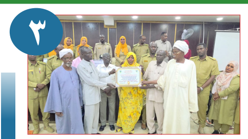
صحيفة (شيكان) تتحصل على إفادات مهمة من قيادات اللجان التيسيرية لأحياء إدارية أبوشراء