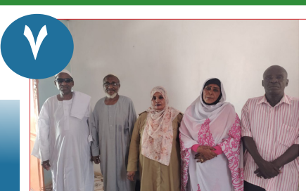
اللجان التيسيرية بشيكان.. حراك مجتمعي يستنهض الخدمات ويعزز معركة الكرامة