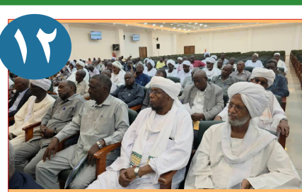
شمال كردفان تطلق العام الدراسي المسرع في مايو ٢٠٢٦ معالجة الفاقد التعليمي وإعادة بناء التعليم

الاثنين ١٢ أبريل ٢٠٢٦ م الموافق ٢٥ شوال ١٤٤٧هـ