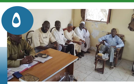
اللجان التيسيرية باحياء محلية شيكان: المهام .. الأدوار .. والتحديات في الظروف الاستثنائية